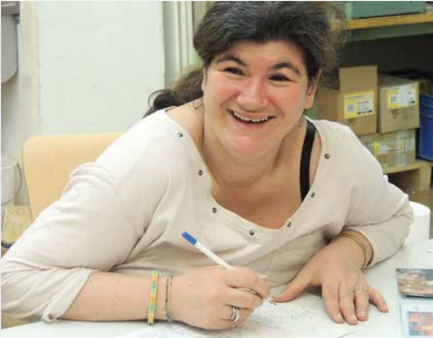
Die 14 schönsten Kunstwerke dienen als Vorlage für hochwertige Weihnachtskarten

Die behinderten Menschen der Humanitas Stiftung haben mit Leidenschaft und grosser Kreativität Sujets für Weihnachten 2016 kreiert. Die schönsten 14 Sujets bietet die Stiftung als Weihnachtskarten an.